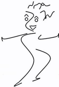
Welle-Welle (~) ~)